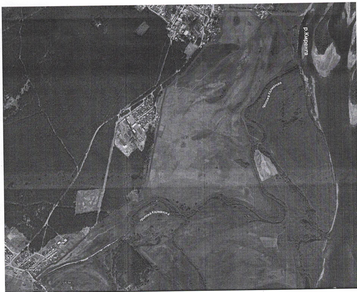
СХЕМА территории площадью 200 Га для организации мест выпаса скота для микрорайона “Аэропорт”, “Авиагородок”, “Балахня” г.Киренска и д.Коммуна.

приложение №1 к постановления администрации Киренского городского поселения от ___ апреля 2016 г. № _____